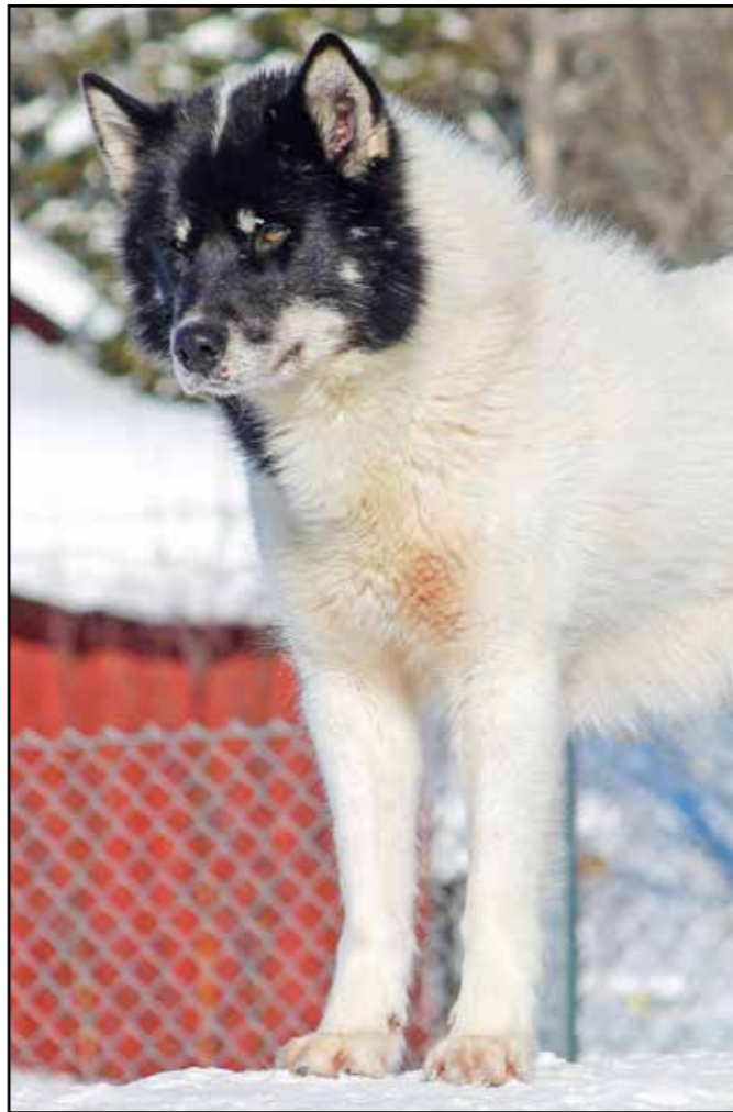
Utmärkt maskulint kraftfullt huvud med bra bredd, Bra kraftig benstomme och starka mellanhänder.

Framtassarna skall vara tämligen stora, kraftfulla och rundade med starka klor och trampdynor.