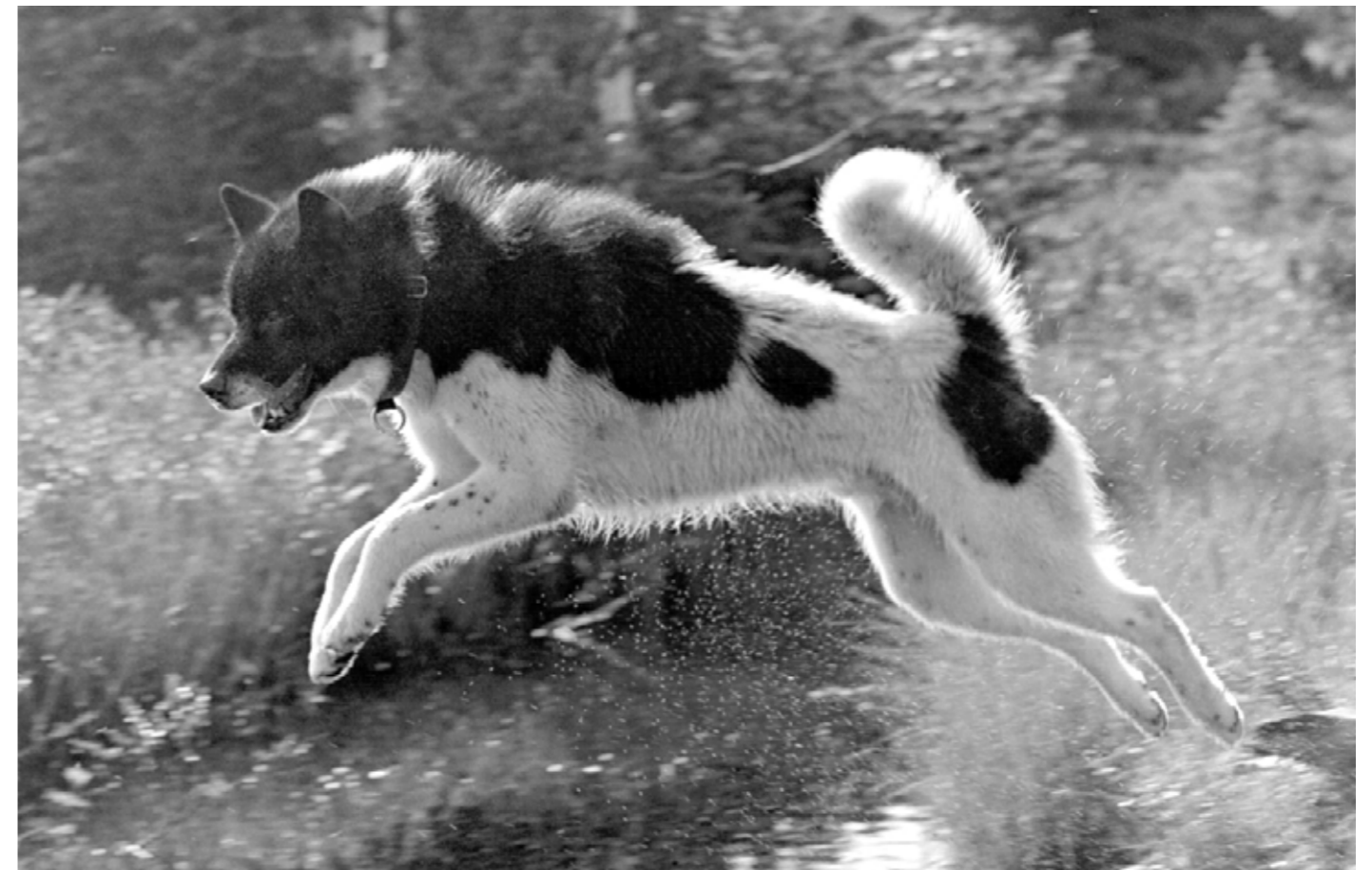
En grönländshund är mycket vig och smidig!