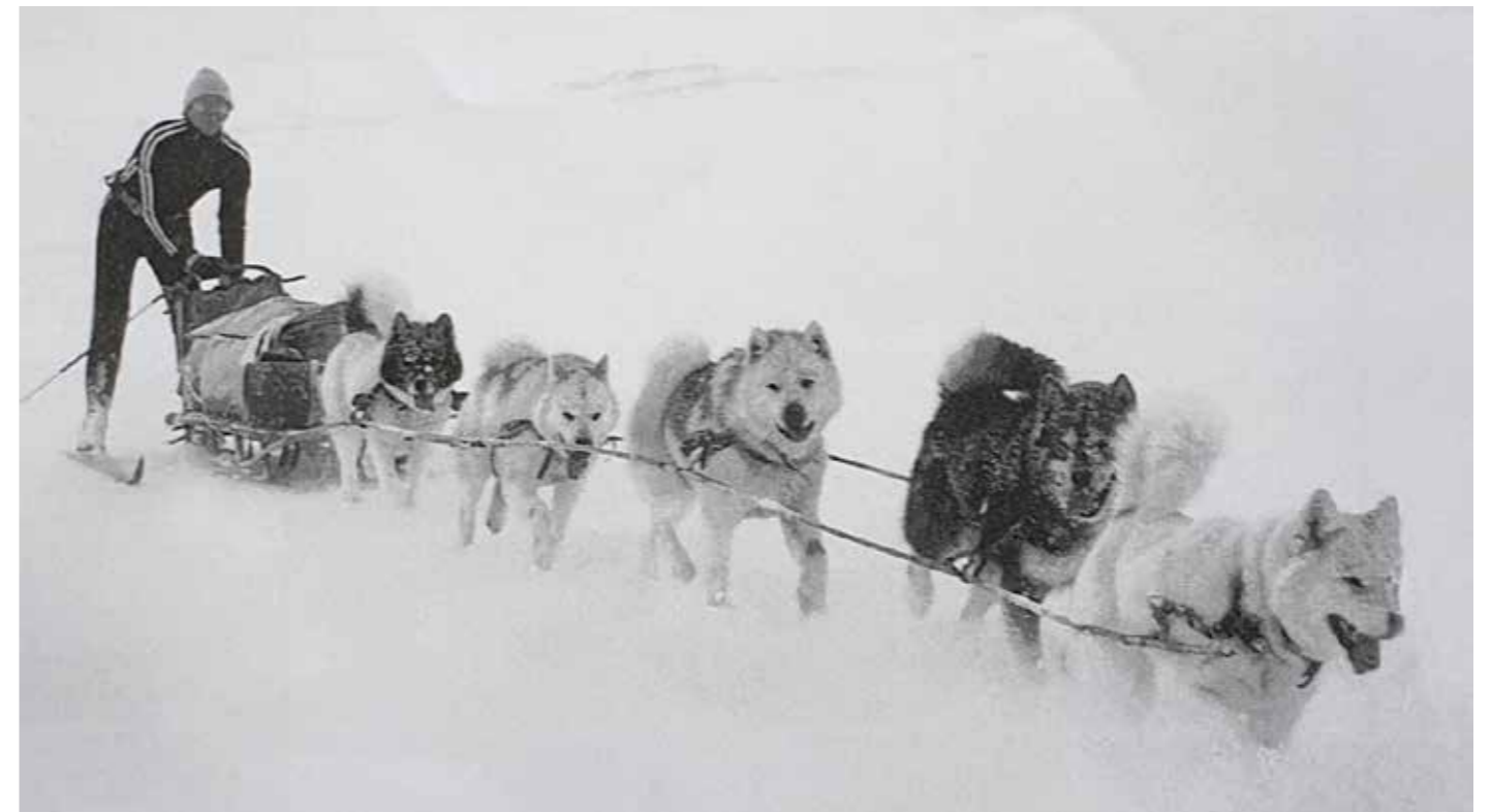
Grönländshundar i nordisk anspänning. Goda rasrepresentanter alla fem. Vid arbete under lång tid och med tung belastning visar sig hundens exteriöra fel och förtjänster. En välbalanserad kropp med vinklar som möjliggör ett vägvinnande steg utan krafllöseri är en förutsättning för ett gott resultat. Det är förutsättningarna för detta, i kombination med det raskaraktistiska utseendet, vi vill ha bedömt i ringen.