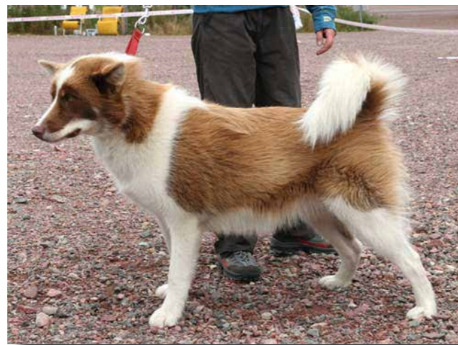
Utmärkt grönländshund som dock vid fotoögonblicket inte har önskvärd stramhet.

Allmän och uppenbar aggressivitet mot andra hundar bör också betraktas som ett fel, då det menligt inverkar på hundens användbarhet vid spannkörning.