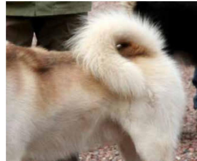
Svans som är för hårt ansatt mot kroppen.