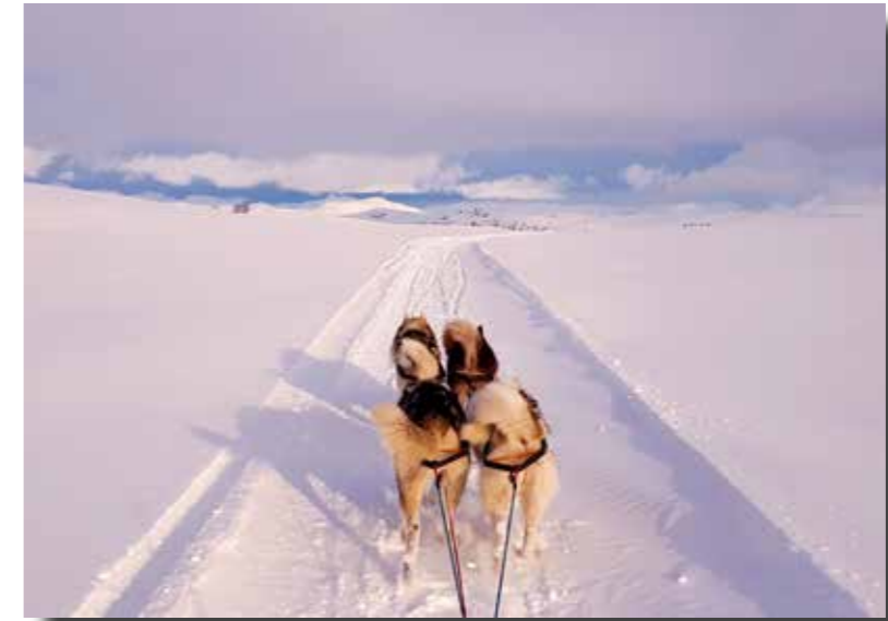
Grönlandshunden i sitt rätta element. Det är så vi vill se den - nu och i framtiden. Rasens ursprung och funktion kan inte nog betonas!

Ur FCIs standard: ”Grönlandshund är en av världens äldsta hundraser och har sedan urminnes tider varit inuiternas enda slädhund.”