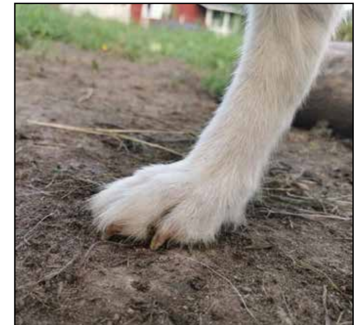
En mindre tass med lite spretande tår, därmed inte lika stark och tålig som den vänstra.