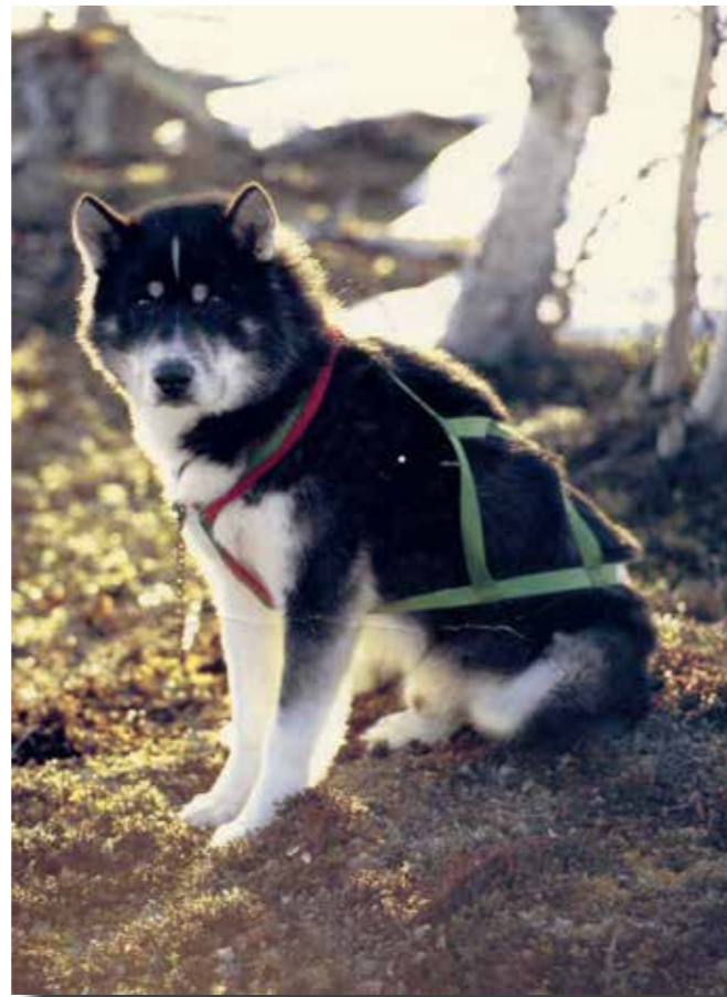
En på alla sätt rastypisk grönlandshund där det vid första ögonkastet tydligt syns att det är en hanhund.

Hunden får inte ge ett kvadratisk intryck.