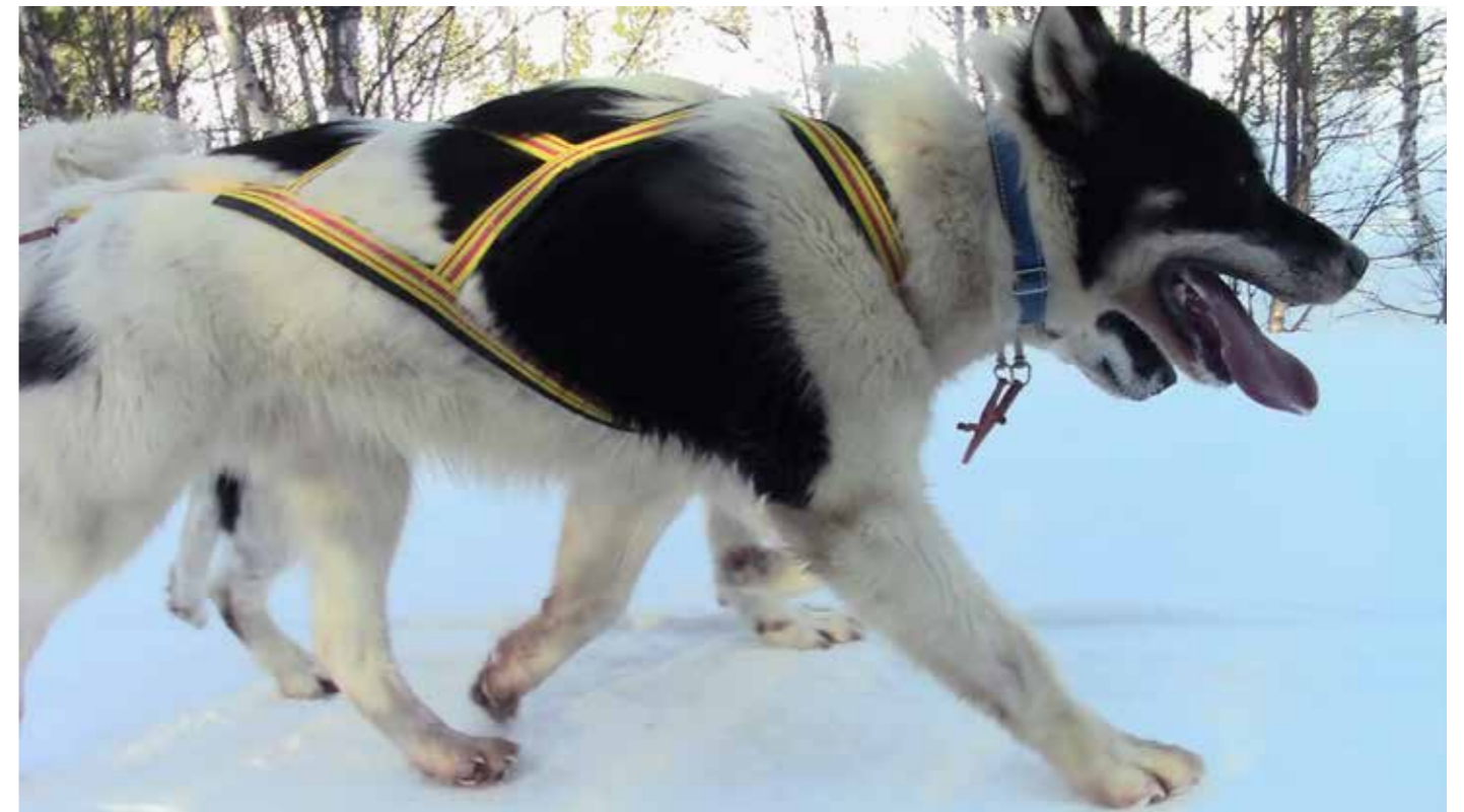
Utmärkt steg och huvudhållning, notera att framtassen hinner lyftas innan baktassen sätts ner i nästan samma spår.

Helhetsintrycket får dock givetvis vara det avgörande för denna bedömning.