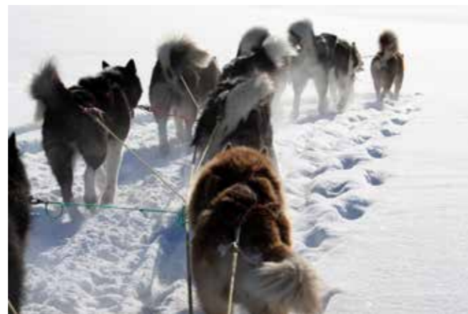
Med sin robusta natur passar grönlandshunden friluftsmänniskor.