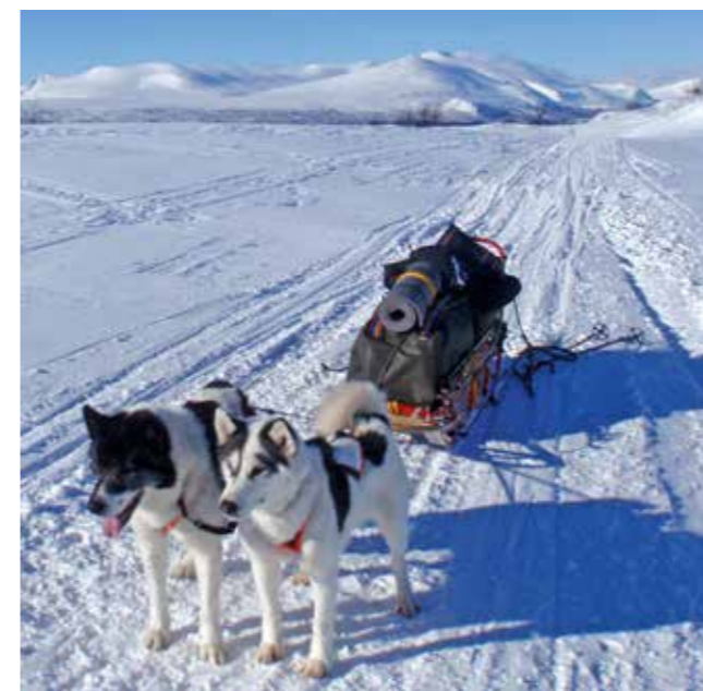
Nordisk körstil framför pulka.

Historiskt har rasen tillhört nästan uteslutande friluftsfolk som med hundarna som sällskap och draghjälp tillbringat kortare eller längre perioder på fjäll- och skogsturer. Avgörande för val av avelsdjur har i hög grad varit deras egenskaper som bruksdjur. Tidigare kördes grönlandshunden vanligen i tandemspanning framför pulka och föraren följde spannet på skidor, det vi idag kallar för nordisk körstil. Denna anspänningsform innebär att hundarna hålls på sina platser mellan de fasta skaklarna. Idag är den vanligaste formen av nordisk anspänning med en mittstång mellan hundarna. Körning i lösa linor, som blivit vanligt först från ca 1980-talet, ställer betydligt större krav på hundarnas sociala egenskaper. Detta har påverkat rasens utveckling positivt i den bemärkelsen att man i ännu högre grad än tidigare uppmärksammat det värdefulla i att hundarna kan acceptera varandra väl i spannet och att slagsmålsbenägenhet blivit ett allt större minus vid bedömning av en hunds bruksegenskaper och därigenom även dess avelsvärde.