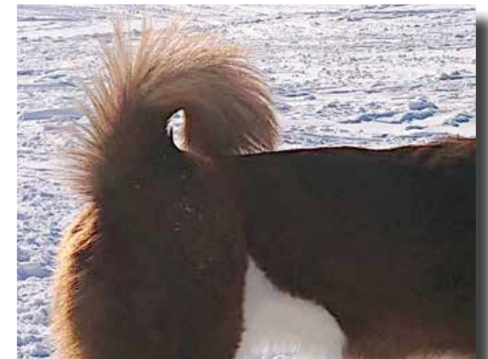
Svans som är löst rullad över ryggen