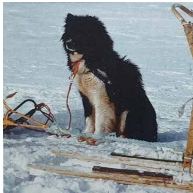
Fel hårlag. En "makriok", d.v.s. lång och mjuk päls som på frambenen t.o.m bildar fana.