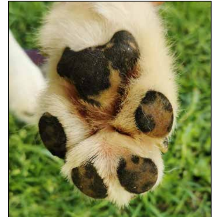
Sommarbild av en naturligt sliten tass efter att ha sprungit på barmark. Tassen är inte klippt. Observera vilken skillnad årstiden gör!