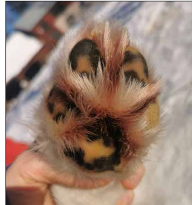
Vinterbild av en osliten tass med en skyddande hårrem av god längd.

Baktassar: Baktassarna skall vara tämligen stora, kraftfulla och rundade med starka klor och trampdynor.