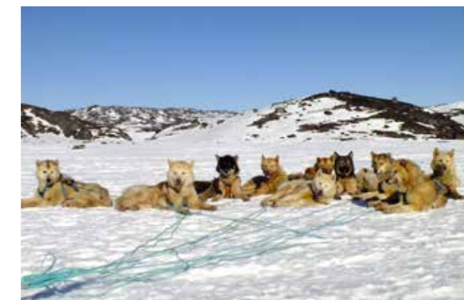
En grupp vilande grönlandshundar på Grönland. Notera solfjäderanspänningen!

De första grönlandshundarna som kom till Sverige var dels sådana som tagits med hem av män som själva tjänstgjort på Grönland eller Svalbard, dels avkommer efter norska hundar. Utbytet med Norge har i alla tider varit stort, däremot har karantänsbestämmelser försvårat införsel av nya hundar från Grönland. Vaccinationskravet mot dvärgbandmask för inresa i Norge har under senare år dessvärre medfört ett minskat resande dit och därifrån, vilket naturligtvis i sin tur ger en minskad kännedom om norska hundar.