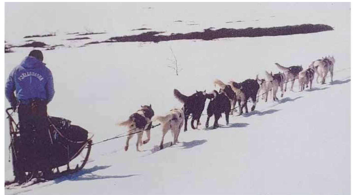
I nomeanspänning ställs förutom alla andra krav även krav på social fördragsamhet mellan hundarna. Notera blandningen av färgteckningar och storlekar. Alla lika goda, ingen mer eller mindre önskvärd än den andra.