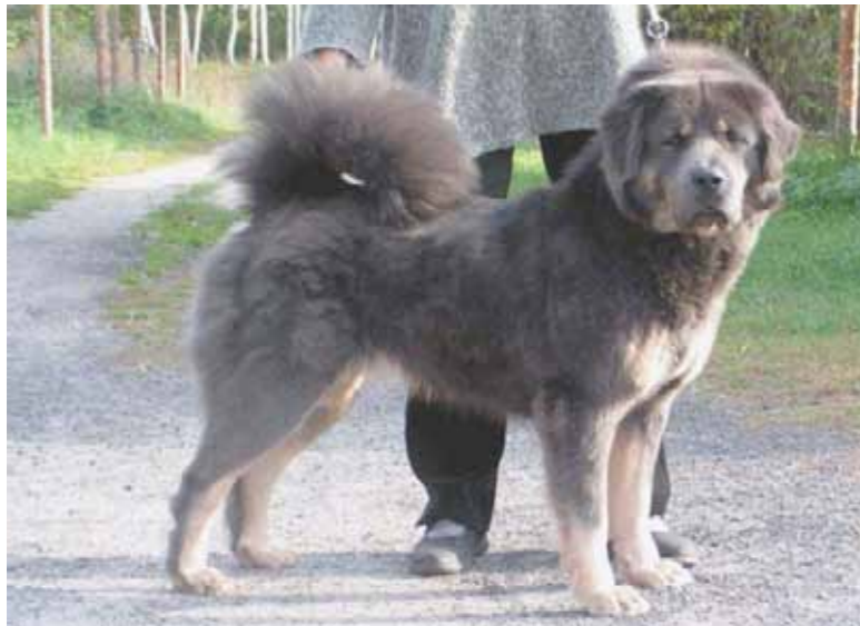
Blå och Tan, ung tik med utmärkta proportioner