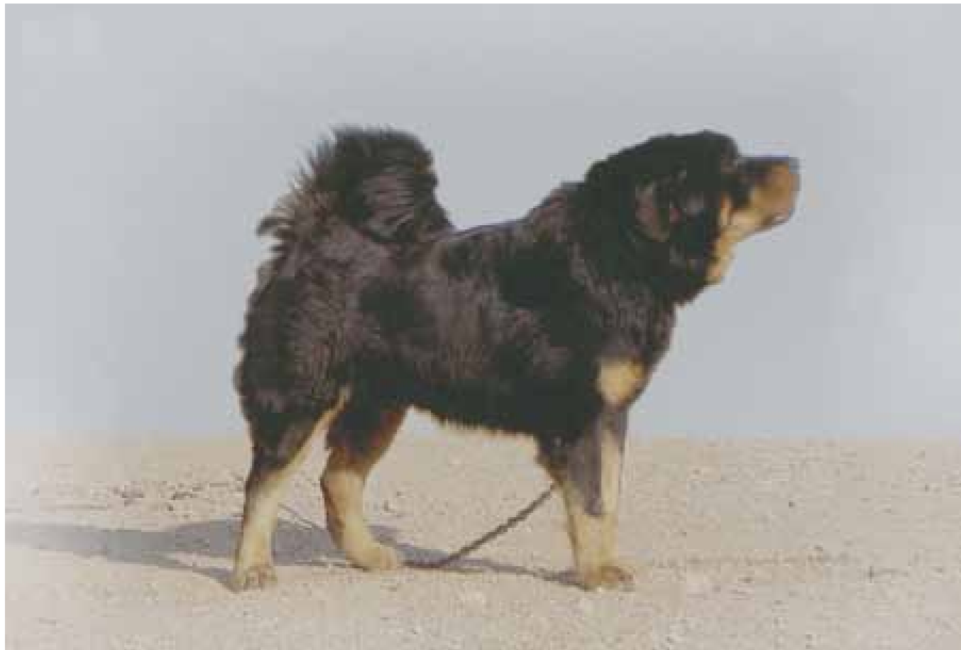
En vaktande, kraftfull och välbalanserad Tibetansk Mastiff i Kina