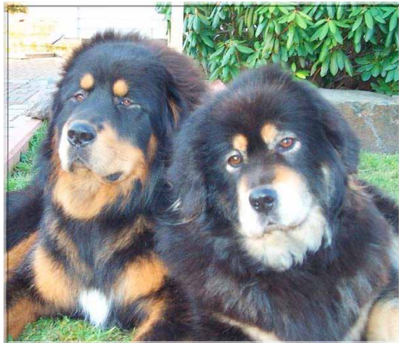
Utmärkt hanhunds- och tikhuvud. Hanen t.v. har något små och djupt placerade ögon.

Den Tibetanska Mastiffen har en reserverad hållning till främmande människor. Varsamhet och respekt krävs vid genomgång av den i utställningsringen. Hälsa alltid först på ägaren. Tibetanska Mastiffen är värdig och avvaktande dock ska den tillåta att bli hanterad. De flesta hundar i rasen har inte det oftast eftersökta "utställningstemperament" och det söker vi inte heller i denna ras.