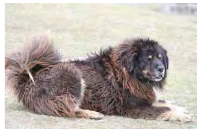
Svart och tan, hanhund av utmärkt typ