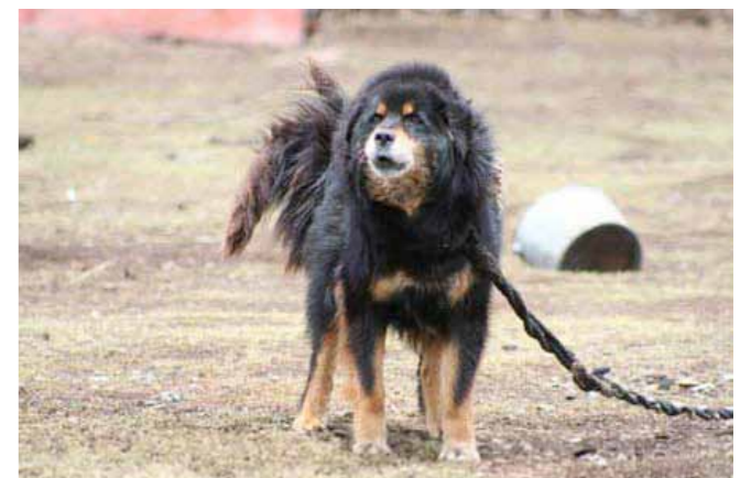
Svart med mörk tanteeckning