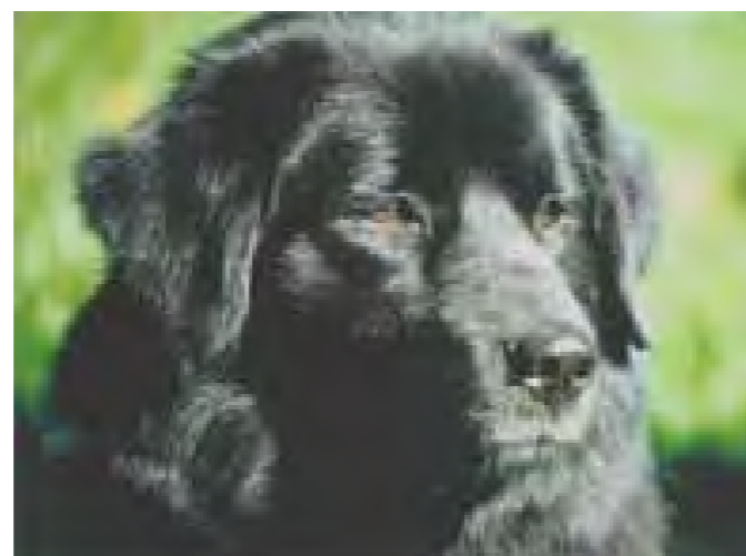
Sött uttryck, dock ej typiskt. Saknar stop, tunt nosparti och klen underkäke.