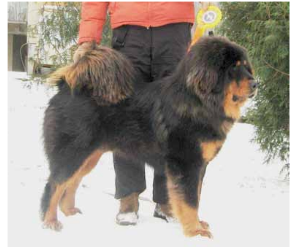
Hane med utmärkt helhet

Tibetansk mastiff är kraftfull, tung och välbyggd med god benstomme. Den är imponerande med ett värdigt och allvarligt utseende. Rasen kombinerar mäktig styrka, tålighet och uthållighet; egenskaper som gör att den klarar av att arbeta i alla klimatförhållanden. Tibetansk mastiff utvecklas långsamt. Tikar är färdigutvecklade först vid 2 - 3 års ålder, hanhundar tidigast vid 4 års ålder.