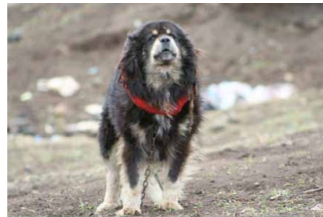
Svart och ljus tanteeckning