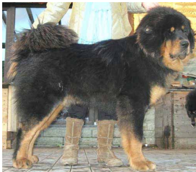
Black and Tan hane som är kraftfull och välbalanserad