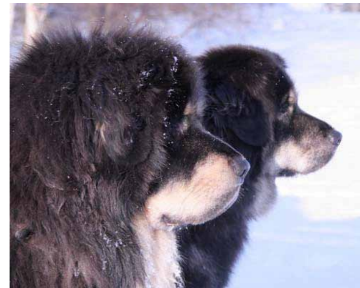
Hanhunds- och tikhuvud med korrekta profiler

Stopet skall vara markerat utan att för den skull vara för plant eller för brant.