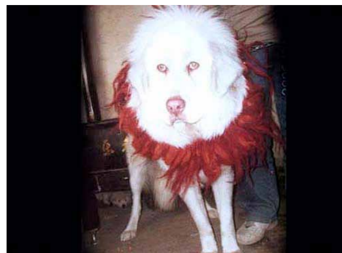
Fel färg och för tunn och lätt, plus mycket dåligt pigment.