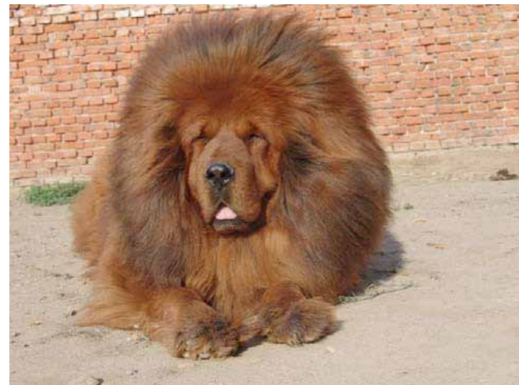
För djupt tätt sittande ögon, dåligt stop och alltför mycket rynkor.