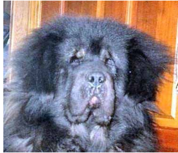
Allt för tunga och tjocka läppar, för djupt sittande ögon, överbepälsad på öronen.