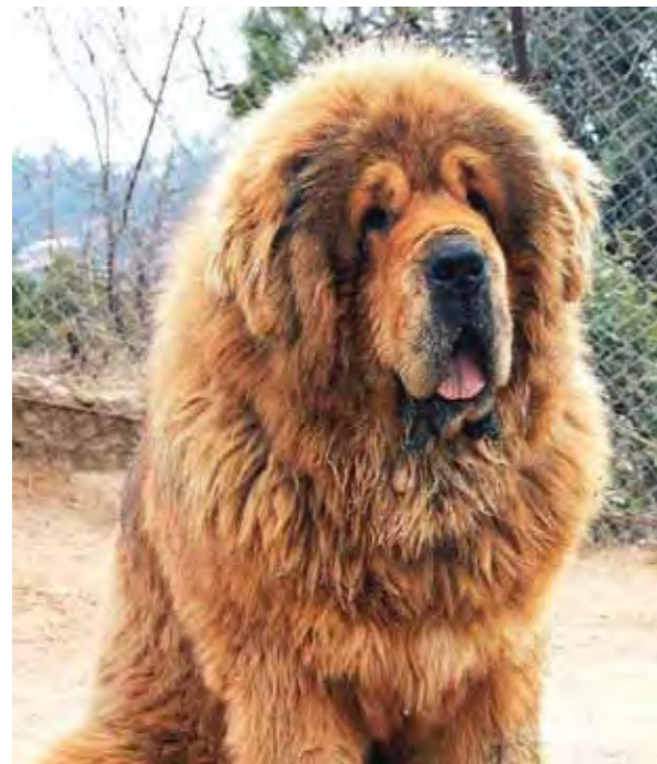
För mycket rynkor över ögonen och lymfatisk.