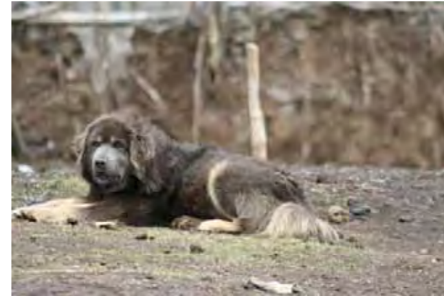
Blå och tan