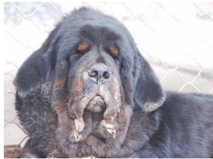
Allt för blodhundslig i huvudet.