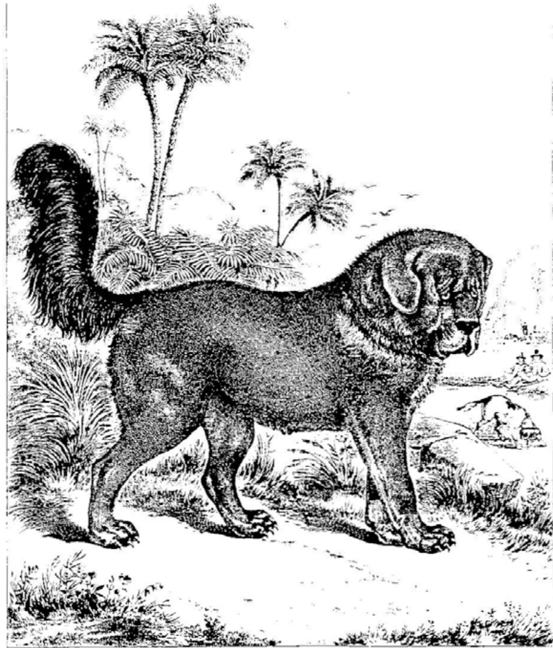
LE DOGUE DU THIBET

Ur "Imagerie D'Epinal" 1796 "Le dogue du Thibet"