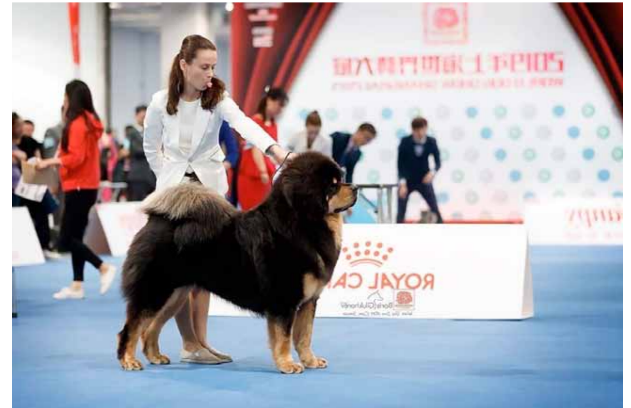
Tik med utmärkt helhet