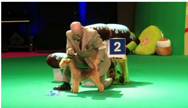
Väl presenterad rasrepresentant