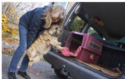
Inga transporter för den dräktiga tiken de sista två veckorna före valpning!

Några punkter att fundera kring: Finns skillnader i den sociala miljön? (Närvaro och lukt av andra, kanske obekanta, hundar. Social avskildhet/ensamhet.) Finns skillnader i den fysiska miljön? (Tyst och stillsam eller rörlig och bullrig.) Hur hemmastadd