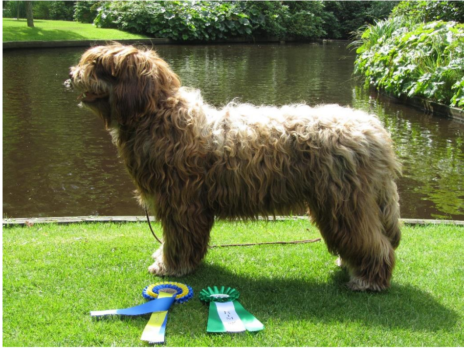
Brun med tanteeckning