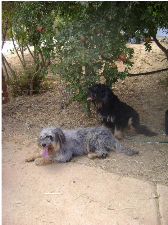
Grå med tanteeckning (den liggande)