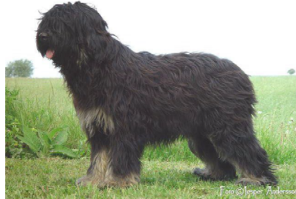
Svart med tanteckning