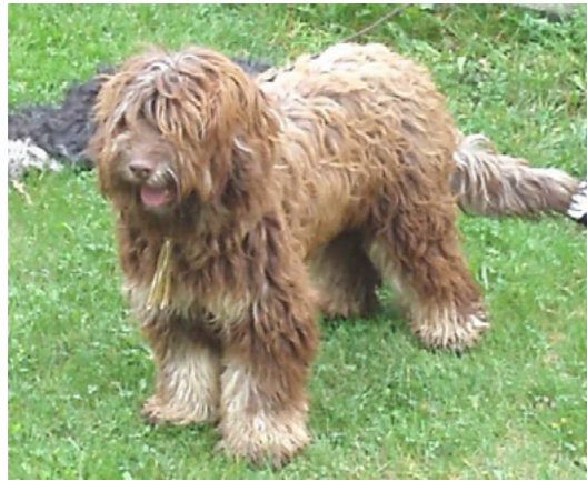
Brun med tanteckning