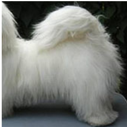
Luftig korrekt svans.