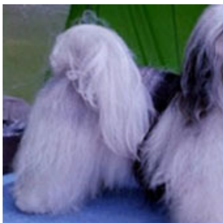
Luftig korrekt svans.