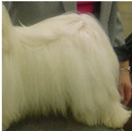
Korrekt hårt rullad svans.