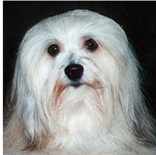
Bra uttryck och färg, något för runda.