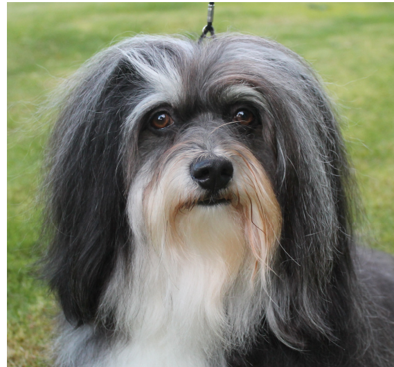
Bra uttryck, för ljusa.