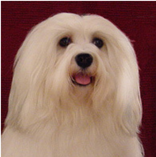
Bra uttryck, färg och form.