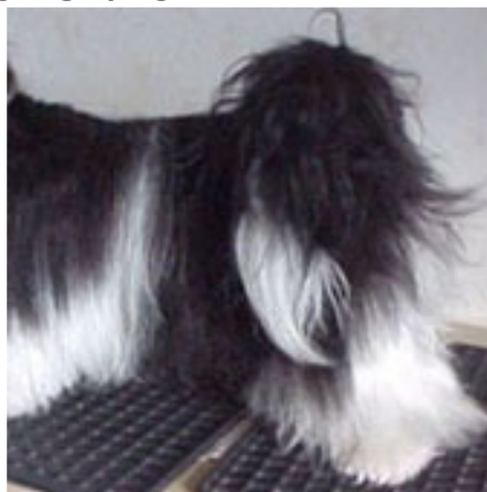
Samma hund vid 1 års ålder.