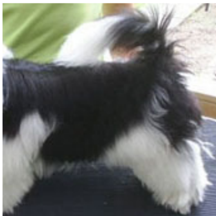
Valp med korrekt öppen svans.