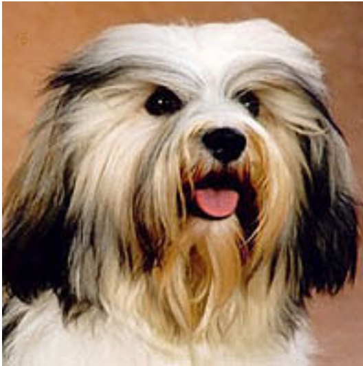
Bra uttryck, storlek, färg och form.