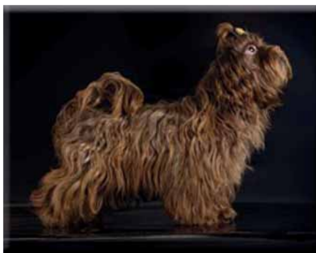
Väl buren svans.