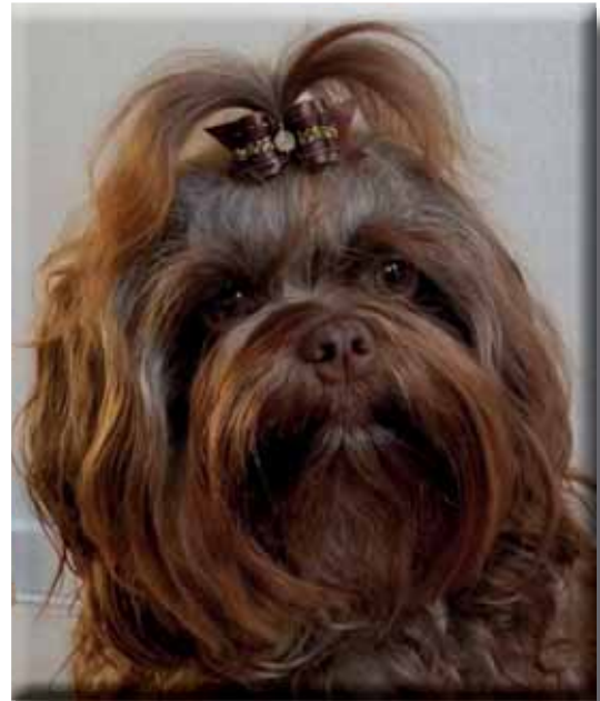
Hane och tik med utmärkt uttryck och fint förhållande nos, ögon.