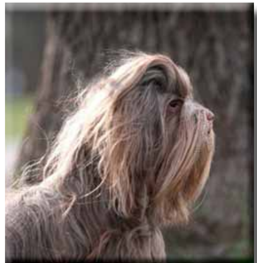
Samma hund framifrån och i profil.