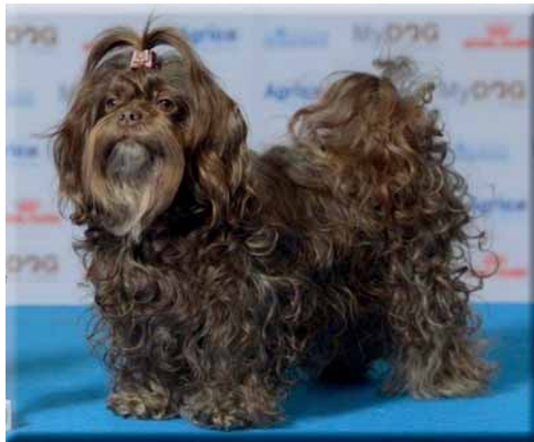
Tik av utmärkt typ.