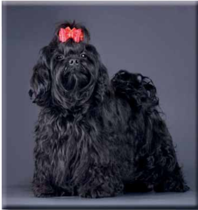
Hane av utmärkt typ.