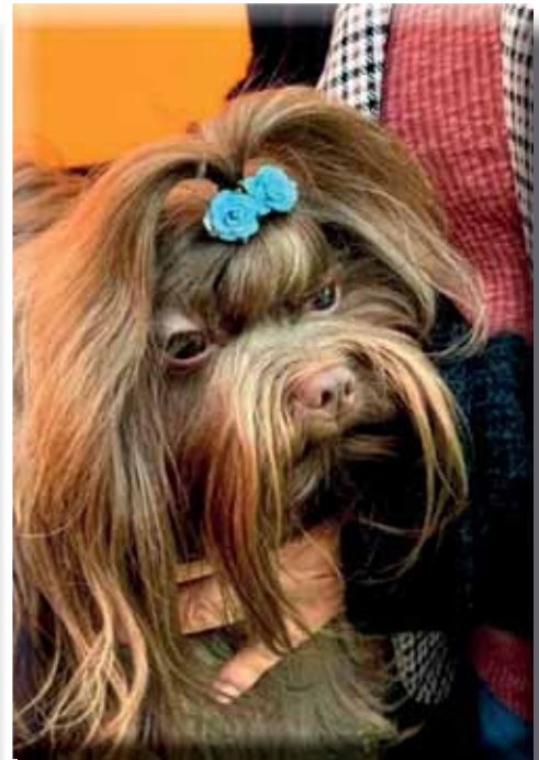
Tik och hane med bra placerade ögon.