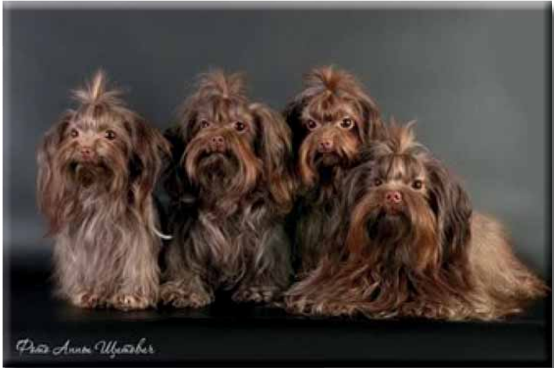
En grupp ryska bolonka med utmärkta uttryck.

Näpen och söt, ingen tydlig könsskillnad.