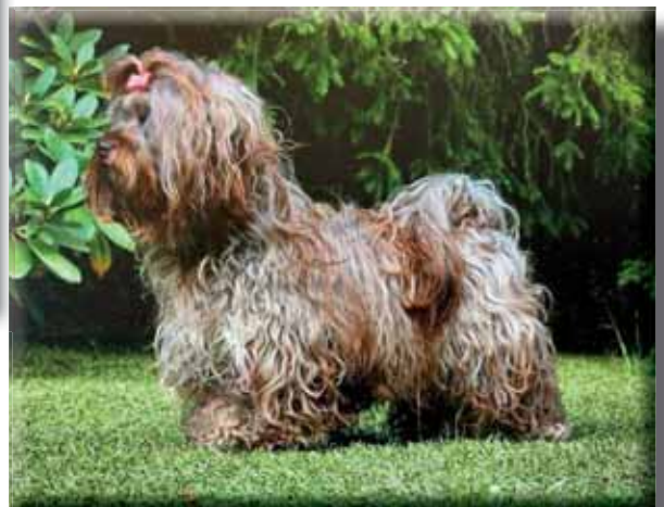
Pälsar med tillräckliga lockar och vågor.