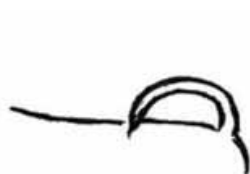
Korrekt ringlad ner över ryggen