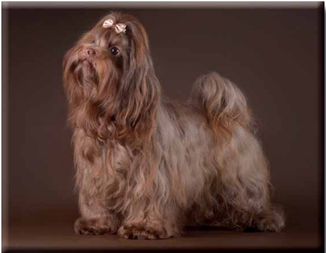
Tik med utmärkta proportioner, rektangulär.