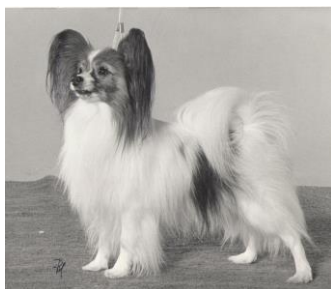
Vinstrika hundar på tidigt 80 tal. Hund på bild veteran. Samma hund bild nedanför, yngre.