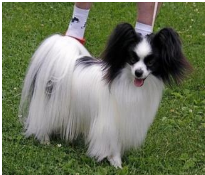
En hanhund med riklig päls.

Märk väl, att det finns en hel del hundar med underull, vilket är fel. Samt att vi har så många olika pälsstrukturer. Papillonerna är fullpälsade först vid ca 3 års ålder. De har alltid 1-årsfällning. Ofta har hanhundarna mer päls än tikarna, men det finns undantag även där.