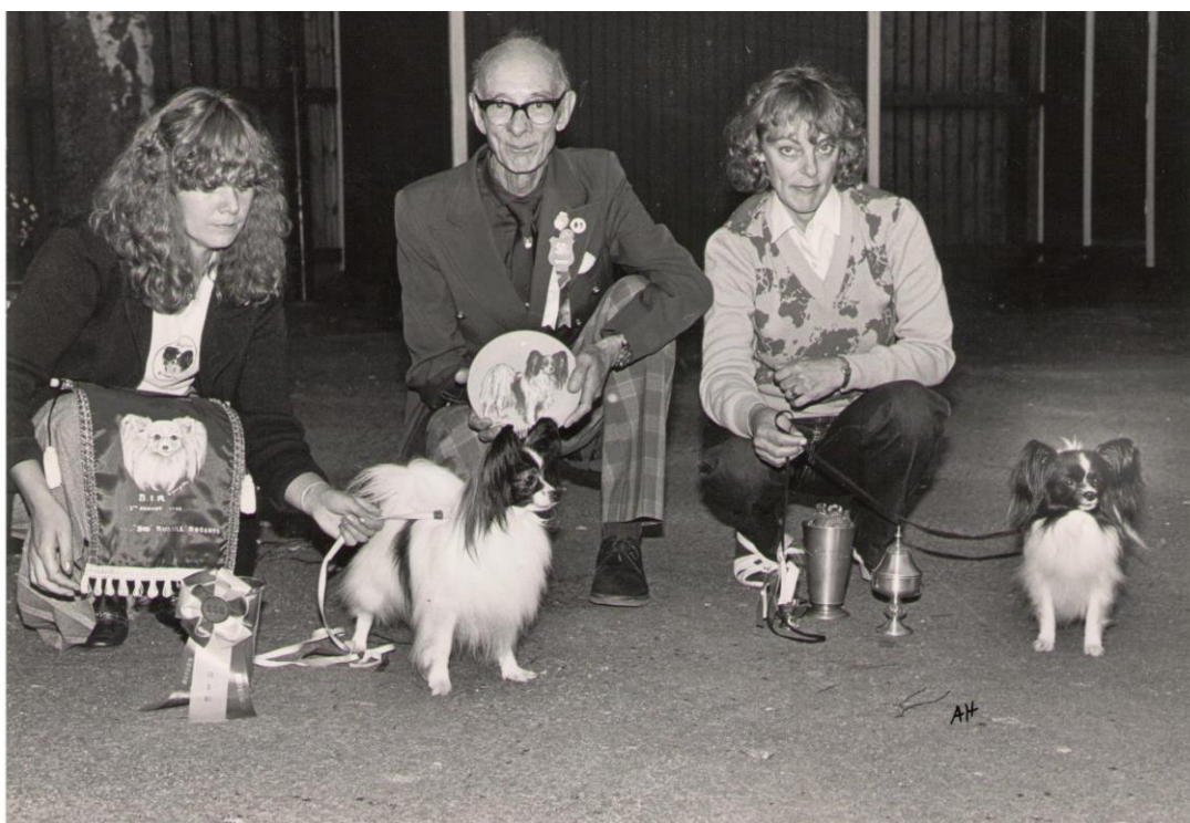
Mycket vinstrika hundar på tidigt 80 tal. 25 cm i manken.