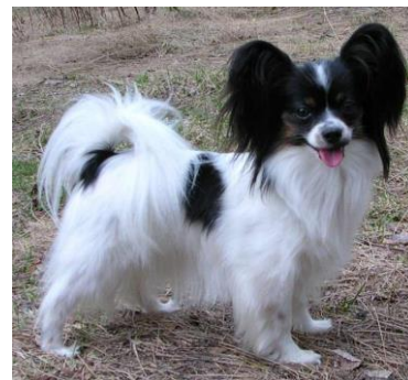
En tik med helt ok päls