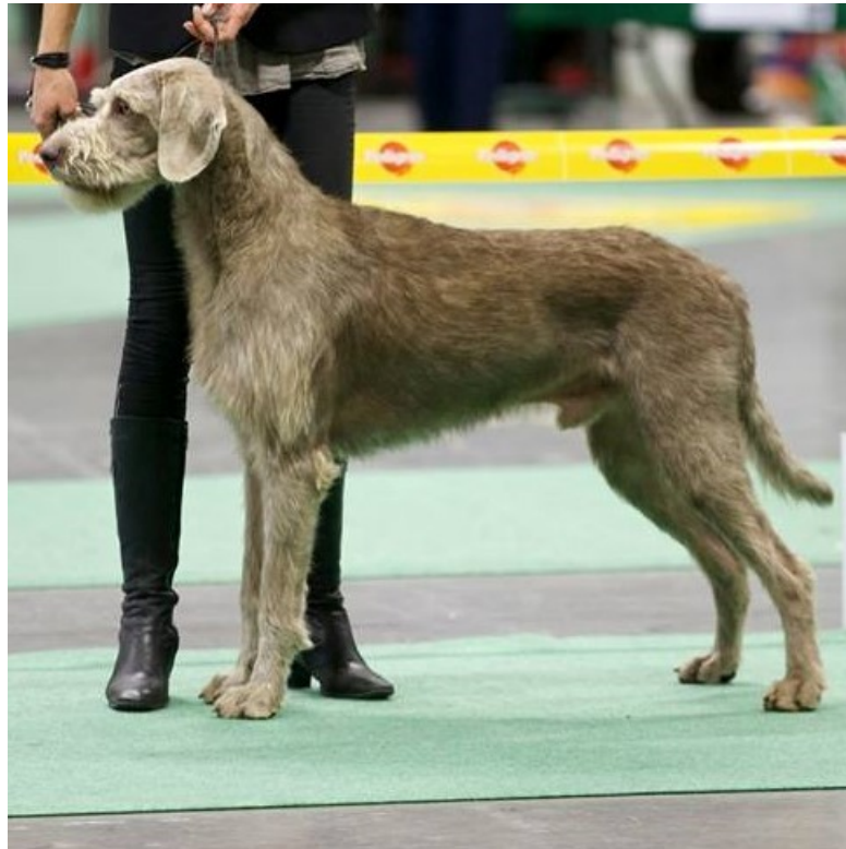
Hane av utmärkt typ.

Diskvalificerande fel: Aggressiv eller extremt skygg: Hund som tydligt visar fysiska eller beteendemässiga abnormiteter skall diskvalificeras.