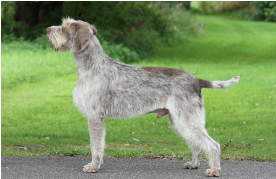
Grey roan coat

Kommentar: färgen varierar från mycket ljus grå till mörkare grå nyanser. Greyroan-färgen förekommer i 20 % av populationen. Greyroan innebär en ljus grundfärg med spräckliga toner av grå i mindre eller större fläckar.