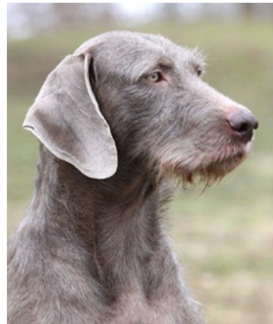
En hane och tik med utmärkta huvuden.