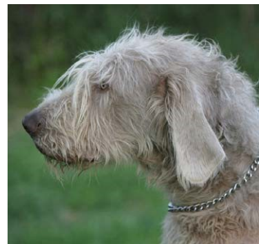
Mjuk och ovårdad päls.