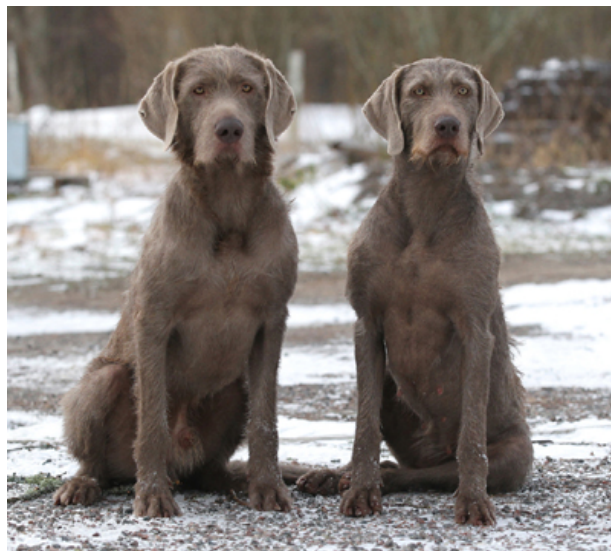
Bra könsprägel hane/tik