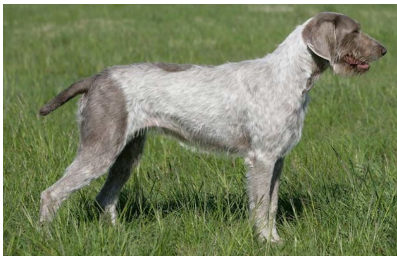
Välbyggd greyroan tik med knapp mustasch och ögonbryn.