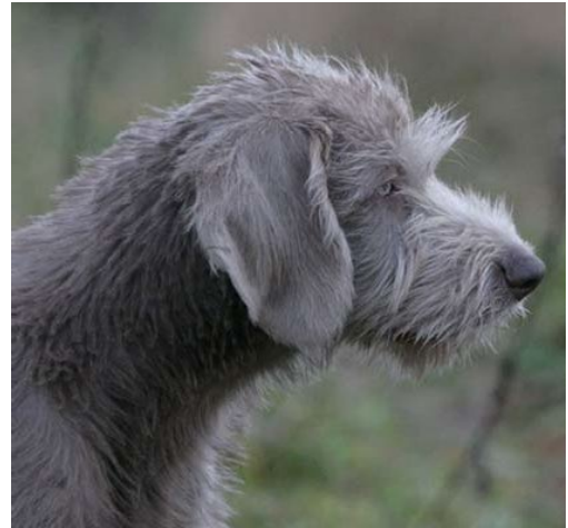
Unghundspäls, för mjuk och otrimmad.

FÄRG - Brunskuggad sobel, kallad "grå", (egentligen genetiskt blekbrun) i olika ljusare och mörkare nyanser, med eller utan vita tecken på benen och bröstet. Även "grå" med mer eller mindre stora markeringar, vilka så småningom blir skimmel.