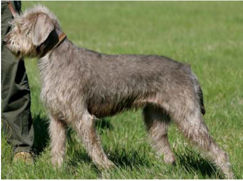
Otrimmad typisk unghundspäls under utväxt. Pälsarna är färdiga först vid 2-3 års ålder.