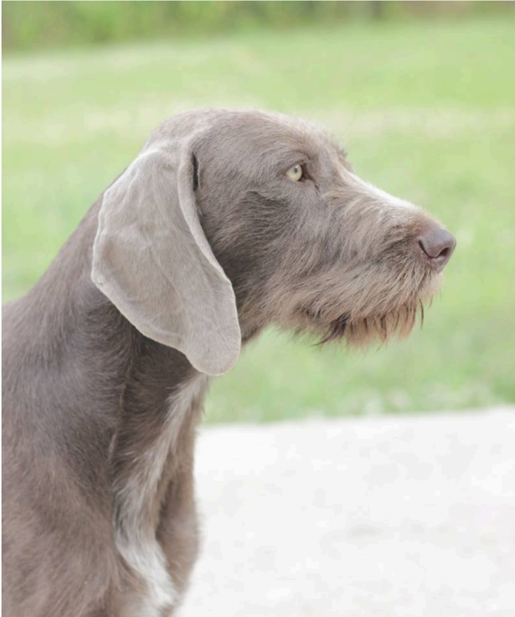
Tikhuvud med härligt uttryck.

Den första av tre registrerade importörer i SKK är tiken Stormdancer A Classic Dream (2008). Hon importerades från England. Ytterligare en tik importerades från England, Stormdancer Sweet Pea, och hon registrerades 2009. År 2012 importerades en tik från Slovakien, Jorky Classic Dreams Milhostovskych Poli. För närvarande är det 21 st svenskfödda i landet.