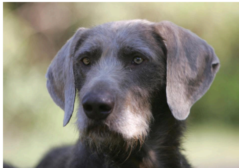
Perfekt formade öron.

Öron - Öronen skall vara proportionerligt långa och ansatta ovanför ögonnivån. Basen skall vara bred och tippen rundad.