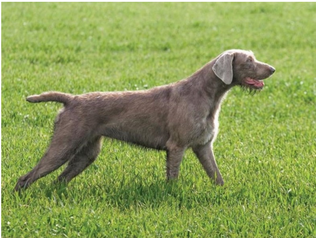
Utmärkt tik med fina proportioner.