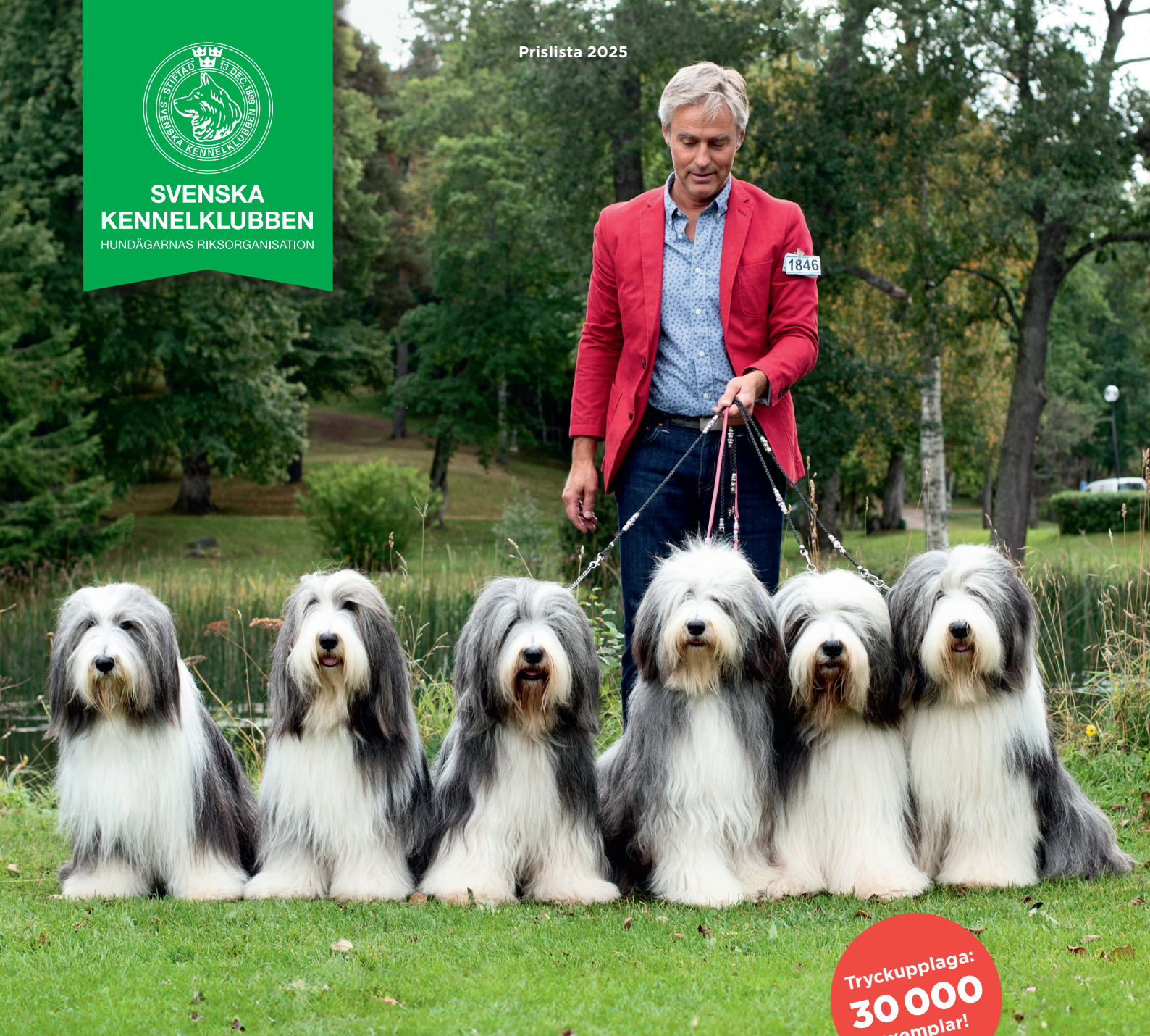
RAS BEARDED COLLIE