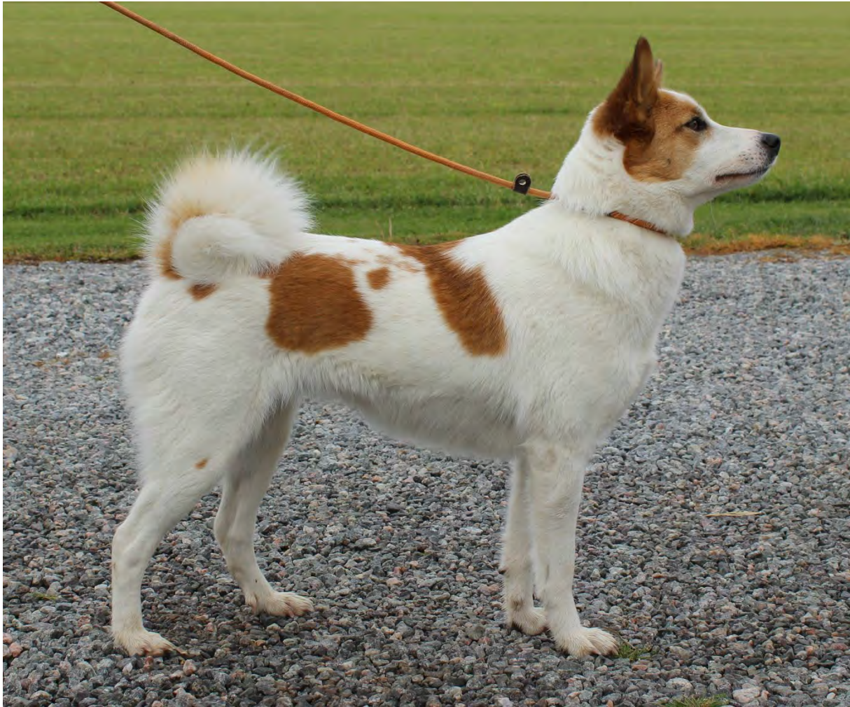
Tik av utmärkt typ