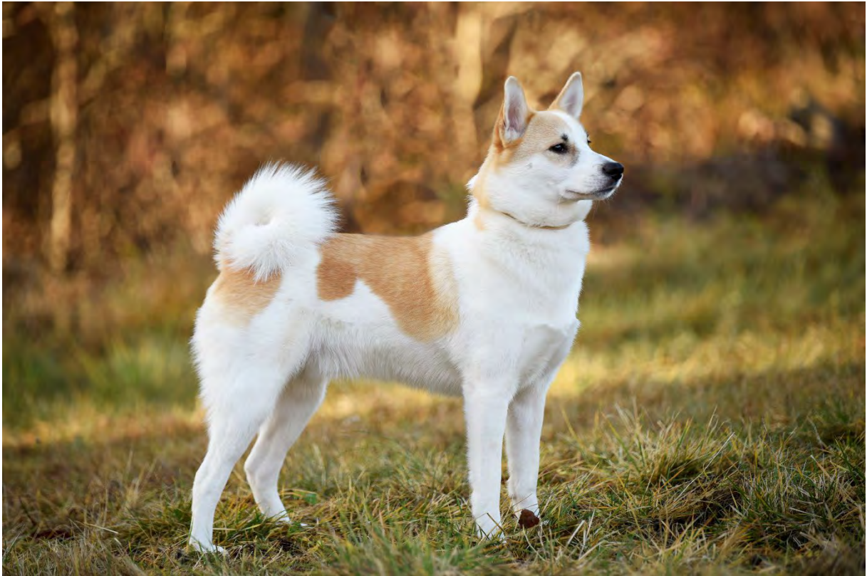
Ovan, hane av utmärkt typ