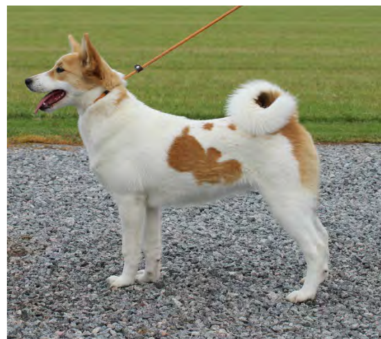
Femmånaders lovande tikvalp