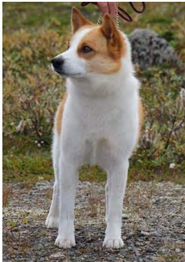
Norrbottenspetsen är parallell både bakifrån och framifrån. Denna hane har även utmärkta tassar.