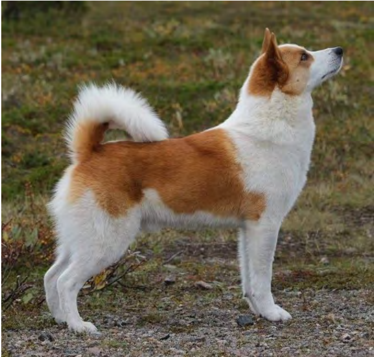
Hanhund av utmärkt typ

Högställda hundar med klen benstomme och liten muskelmassa, liksom grova och tunga hundar med dålig resning motsvarar inte rasstandarderna. Inget av detta är funktionellt för en liten jaktspets.