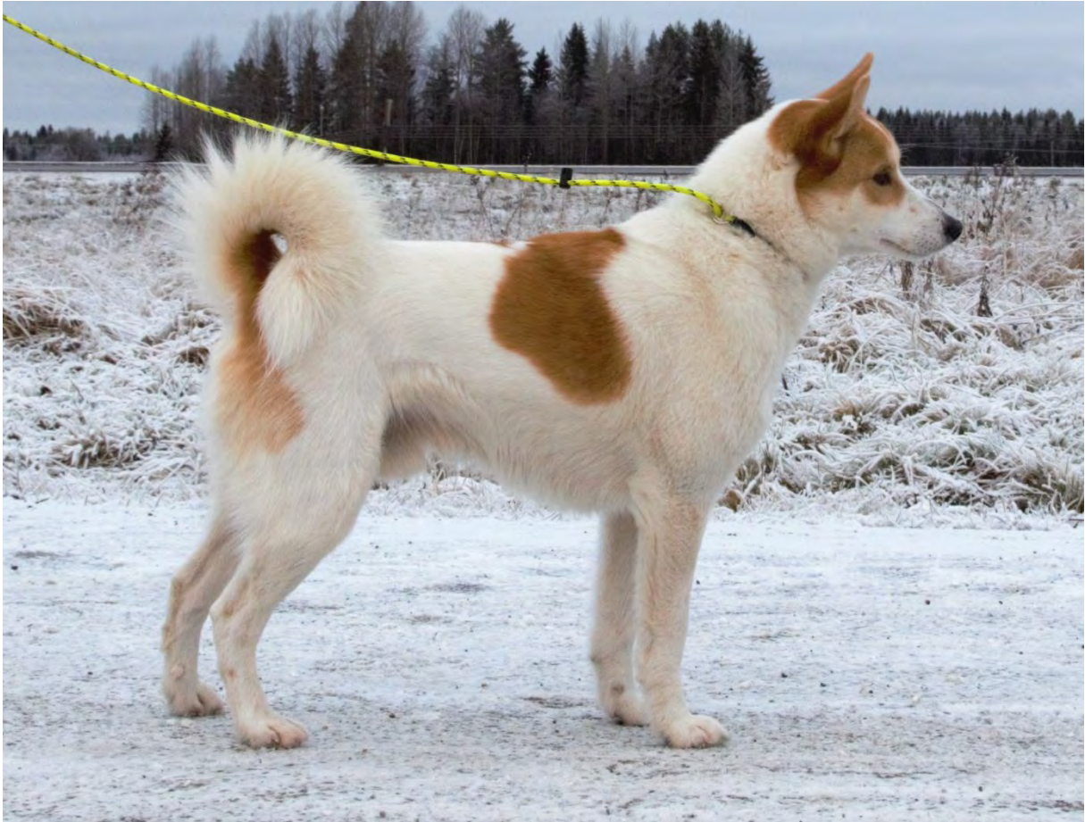
Ovan, hane av utmärkt typ