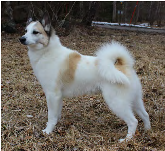
En utmärkt svans med korrekt ansättning