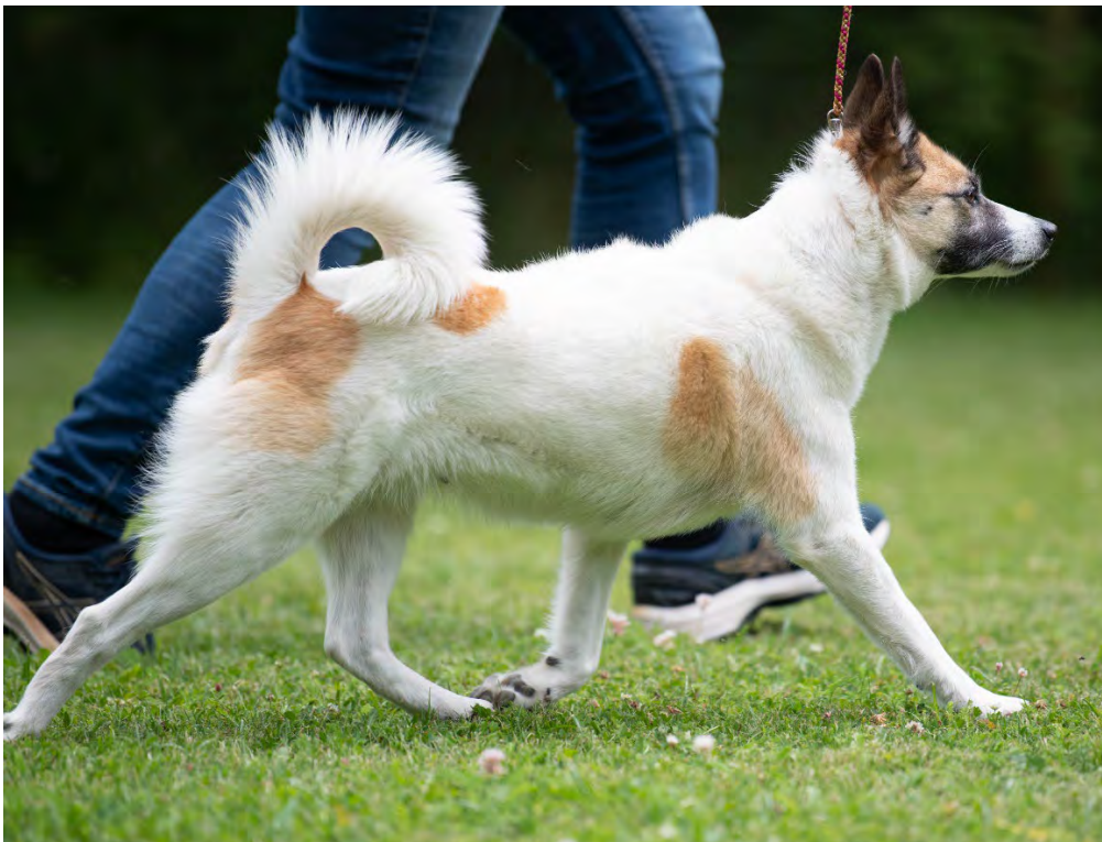
En tik med ett utmärkt kors och utmärkta vinklar som rör sig med ett fritt och marktäckande steg (tiken på bilden är i fällning och har därmed inte en önskvärd päls)

Rörelserna i trav skall vara jämna och flytande med vägvinnande steg och bibehållen fast rygglinje. Rörelserna skall, fram- och bakifrån sett vara parallella.