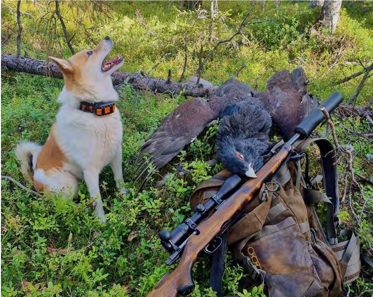
Norrbottenspetsen är en utpräglad jakthund