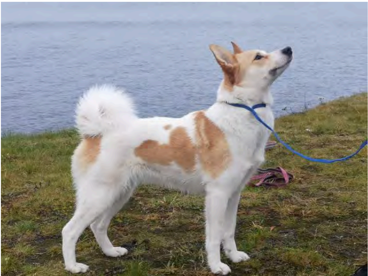
Ovan, tik av utmärkt typ