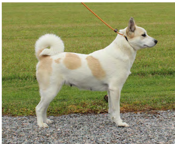
Tik av utmärkt typ