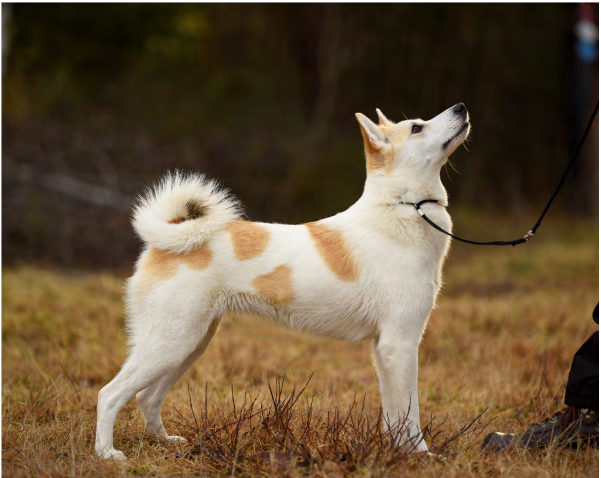
Ovan, tik av utmärkt typ