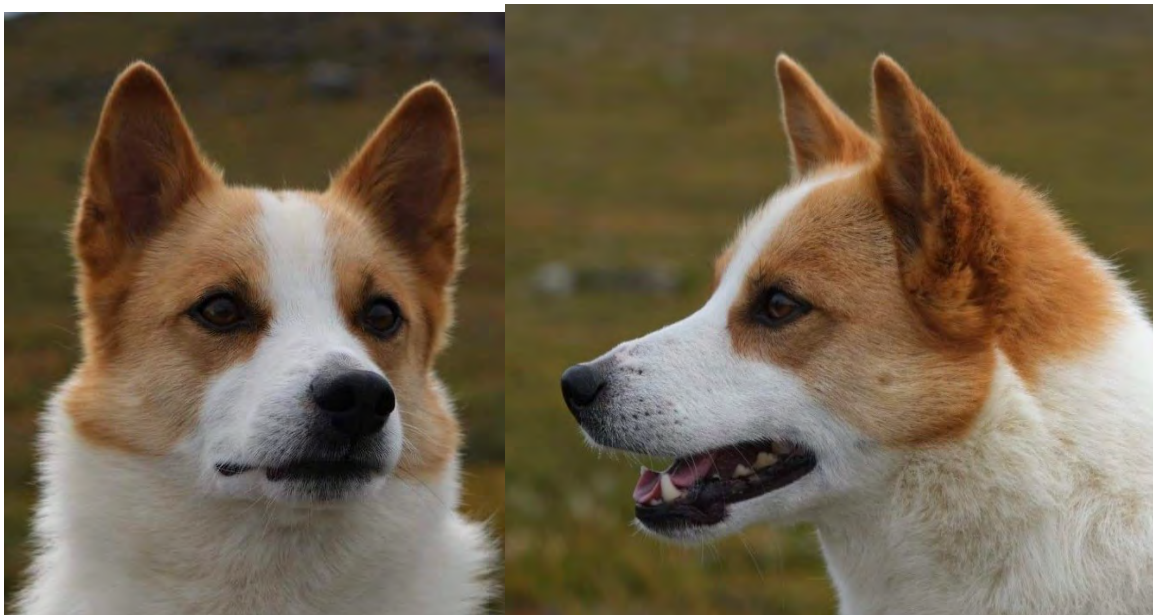
Utmärkta hanhundshuvuden med välutvecklade käkpartier