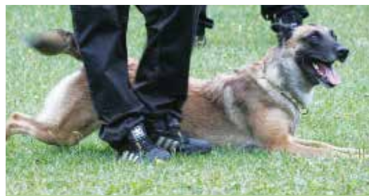
Momentet "kryp" finns med i lydnadsdelen på bruksprovet. På bilden en malinois (belgisk vallhund) under tävling.

Dessa är gömda i omgivningen. Hunden ska, både genom att lyssna efter ljud och genom att få vittring, berätta för sin förare var den upptäcker figuranterna. Hunden ska på avstånd markera för sin förare var figuranten finns någonstans.