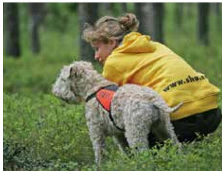
En soft coated wheaten terrier ska ut och leta efter gömda personer i skogen.

Hundens luktsinne används också i grenen sök. Sökhundar tränas och används för att hitta människor. I tävlingsgrenen är det oftast ett skogsområde som används, där är det lättast för figuranterna, som de som gömmer sig kallas för, att gömma sig. Det är sökhundar som vidareutbildas till att leta efter människor i olika katastrofområden - räddningshundar - och vid lavinolyckor - lavinhundar. Sökhundar som vi beskriver här måste gilla människor, även sådana som hunden inte känner. Men om man har en blygare hund kan sökträning vara en väldigt bra träningsform.