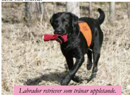
Labrador retriever som tränar uppletande.

Rapport är fartgrenen, men att träna sin familjehund att springa mellan två - för hunden välkända - människor brukar de flesta hundar tycka om. Patrullhunden ska upptäcka vittring och ljud från människor inom ett begränsat område. Här är får vi som hundens förare vara med för att se när hunden upptäcker något - alltså att kunna läsa sin hund.