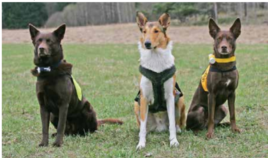
Tre alerta brukshundar, redo för att börja arbeta. Den korthåriga collien i mitten har spårselet på sig och de två australians kelpies är utrustade för rapport.

Bruks är ett gemensamt namn för fem olika provgrenar som Svenska Brukshundklubben (SBK) ansvarar över. Att träna - och tävla - i bruks är förmodligen en av de äldsta formerna av hundträning och början till alla de olika tävlingsgrenar som vi numera har och kallar för hundsport. Men från början var bruksprov och brukshundar en rent samhällsnyttig företeelse. Det var framför allt militären och polisen som behövde det man kallar tjänstehundar för att få hjälp att klara av olika uppgifter. Och tjänstehundar används fortfarande idag, och nu kanske till betydligt fler uppgifter än vad hundarna hade för hundra år sedan. Hundens överlägsna sinnen när det gäller lukt och hörsel är förstås viktiga, liksom ett bättre mörkerseende än vad vi har. Men att hundar rör sig snabbt och lätt, även i svårtillgänglig terräng eller stökiga miljöer gör hunden oöverträffad i många situationer. Men alla dessa goda egenskaper vore inte till någon nytta alls för oss om det inte var för att hunden så gärna vill samarbeta med en människa och att den har stor lust för att lära sig saker och att jobba hårt!