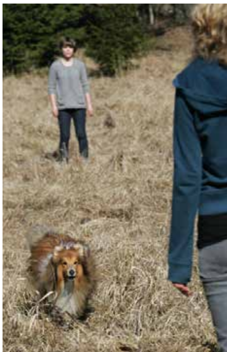
På bilden syns en shetland sheepdog som tränas i budföring.

Brukshundar brukar man kalla de raser som SBK har ett så kallat avelsansvar för. Den hundras som var vanligast förr var schäfer (numera tysk schäferhund), boxer, rottweiler, dobermann, collie och risenschnauzer. Idag har antalet brukshundraser utökats till många flera. I många av bruksgrenarna går det fint att delta med vilken hundras som helst, det vill säga om den är registrerad i Svenska Kennelklubben. Men i vissa av bruksproven får man bara tävla i med en brukshundras - som grenen skydd. De övriga grenarna fungerar dock jättebra för de allra flesta hundar att träna i, oavsett ras. Spår är något som verkligen alla hundar kan tränas i, oavsett storlek eller ras. Sök är en social gren att träna i, här är det en fördel om hunden är social, alltså en som gillar att hitta (gömda) människor.