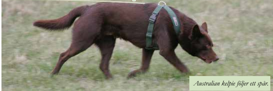
Australian kelpie följer ett spår.

Att hundens främsta sinne är deras luktsinne visste du nog redan. Alla hundar använder i första hand sin nos för att undersöka omgivningen. Likaså vet du säkert att våra hundar härstammar från vargen och att de därför har, mer eller mindre stor jaktlust. De flesta hundar, även riktigt unga, följer gärna doftspår på marken, nyfiket vill hunden ta reda på vad som döljer sig i spårets slut. Det är den här lusten (jaktlusten) att följa ett spår som vi använder oss av när man tränar hunden i bruksspår. Oftast har man en sele på hunden, den underlättar för hunden ”att få ner nosen i marken” och stör inte lika mycket som halsband och koppel. En stor fördel med spårträning är att man kan träna nästan var som helst och att det man behöver är sig själv och hunden.