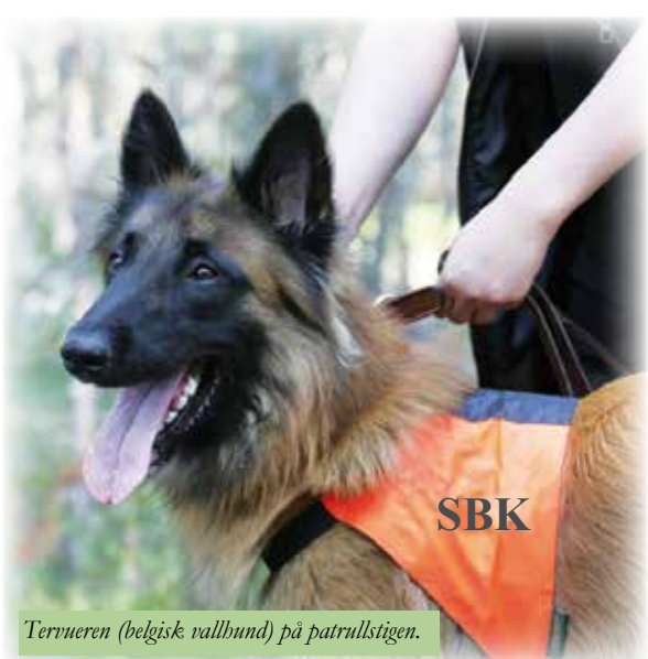
Tervueren (belgisk vallhund) på patrullstigen.

SBK har utbildat tjänstehundar för patrull- och bevakning sedan lång tid tillbaka. Dessa har utbildats för tjänst i hemvärnet. Sedan några år finns det ett bruksprov för patrullhundar som är mer av en tävlingsgren och som också passar för hundar som inte räknas som bruks-hundar. Precis som i övriga grenar tävlar man i lägre, högre och elitklass och med en lydnadsdel som liknar lydnaden på de andra bruksproven. Inom patrull ingår både spårarbete och det som kallas för patrull. Det senare innebär att hunden tillsammans med sin förare ska vandra på en stig eller väg och hunden ska försöka bevaka området och upptäcka figuranter.