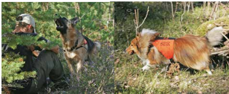
På bilden till vänster ses en schiffer som skäller för att markera att han har hittat en gömd figurant. På bilden till höger har sheltien hittat figuranten och tagit rullen i munnen för att snabbt springa tillbaka till sin förare.

Träningen av sökhunden börjar med att hunden får hälsa på en person som därefter ger sig ut en bit i skogen och gömmer sig bakom till exempel en sten eller ett träd. Vid träning kallas den person som gömt sig för figurant. Hunden kopplas loss och ska sedan själv springa iväg och leta upp personen som gömt sig. Till att börja med ska hunden få översvallande beröm av figuranten när den lyckas. Vi vill att hunden ska tycka att det här är det mest spännande och roligaste som finns att göra. Som förare är man inte i närheten av hunden, så hunden måste lära sig ett sätt att tala om för föraren att den har hittat någon. Man kan använda sig av två olika metoder för att göra det.