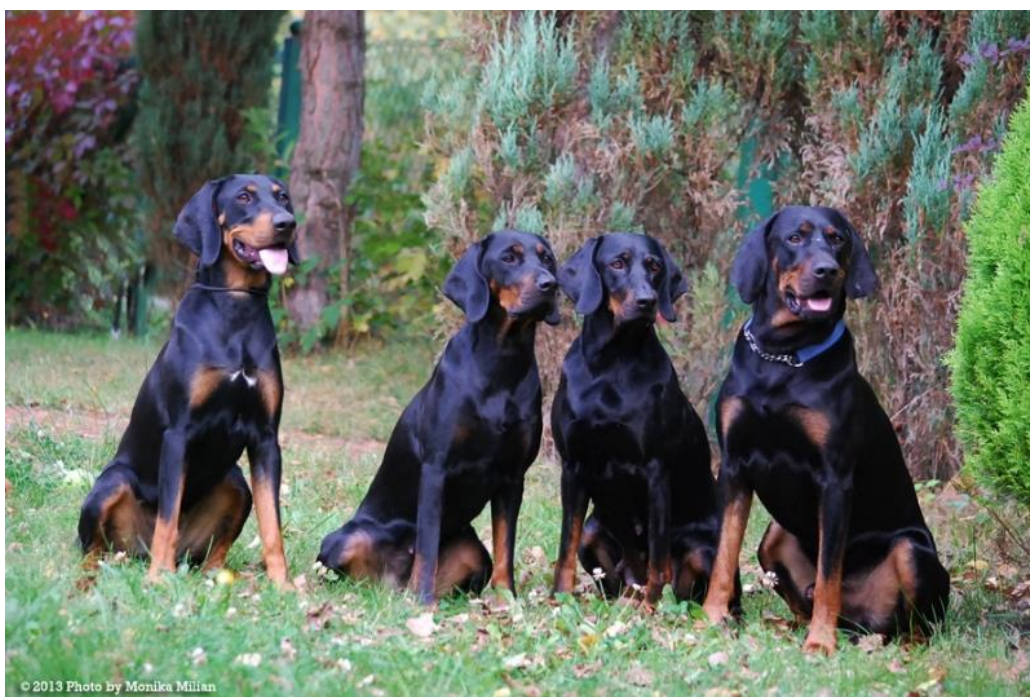
Typiska individer med könsprägel och fullt godkända färger.