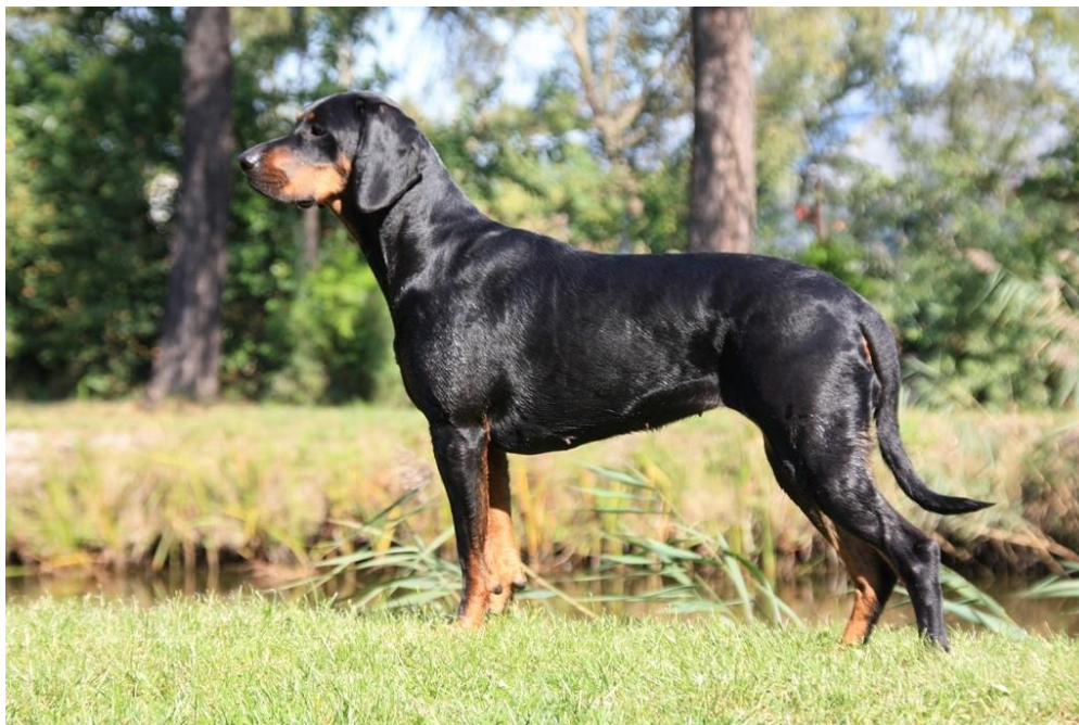
Svart med tantecken

Fotona nedan visar rastypiska exemplar av Goczy Polski i de tre godkända färgerna.