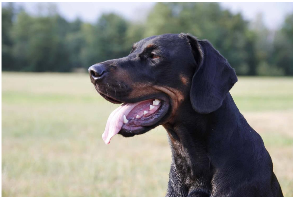
Maskulint huvud av bra längd. Notera korrekt storlek och form på öronen.