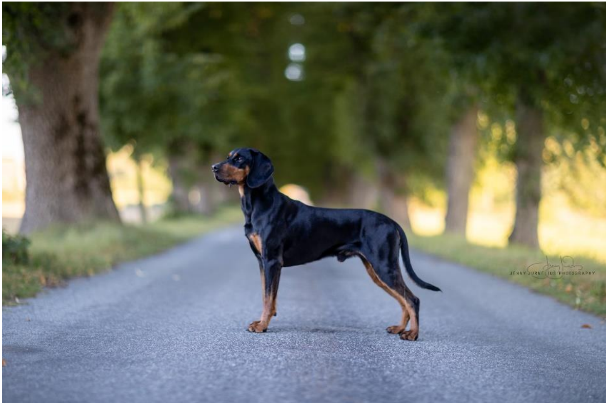
Hane av utmärkt helhet.