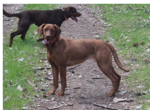
Brun med tantecken Röd