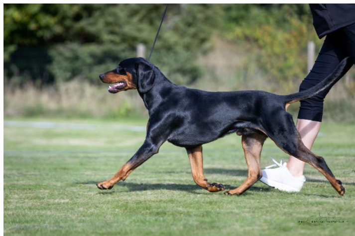
Utmärkta rörelser.