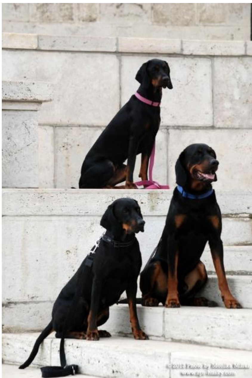
Typiska individer med bra könsprägel.