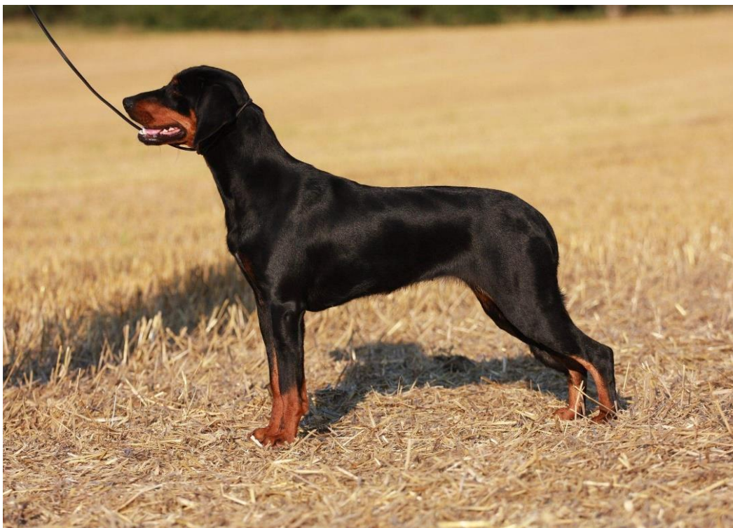
Tik med utmärkta proportioner, vacker päls och tanteckning.