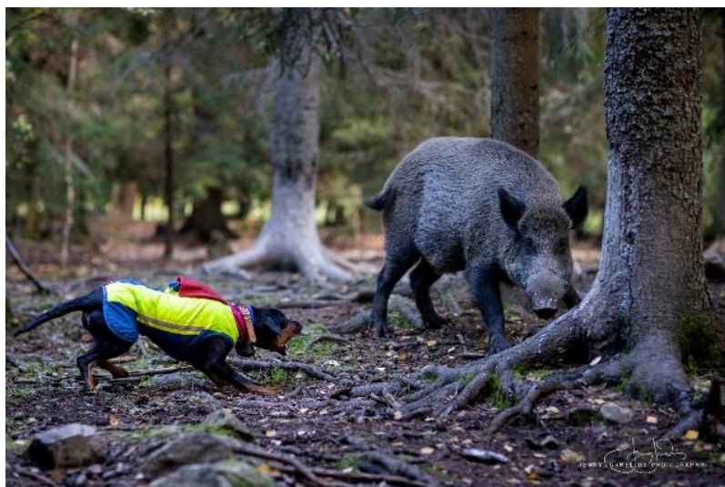
En GP jobbar aktivt runt vildsvinen.

I Polen används rasen mestadels för packjakt eller parjakt och i mindre utsträckning individuell jakt.